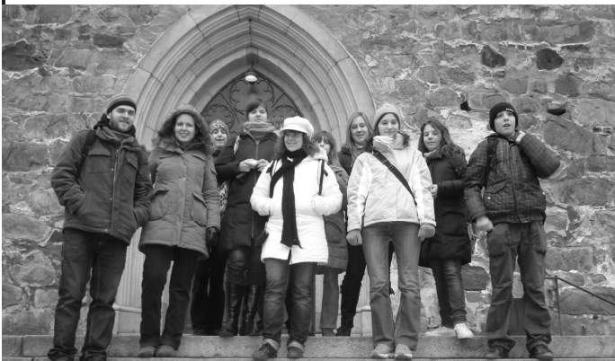
„Csapatunk” a turkui templom bejáratánál