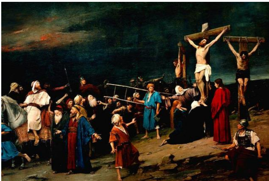
Munkácsy Mihály: Golgota

És mi tudjuk, hogy mi történt Nagypénteken.