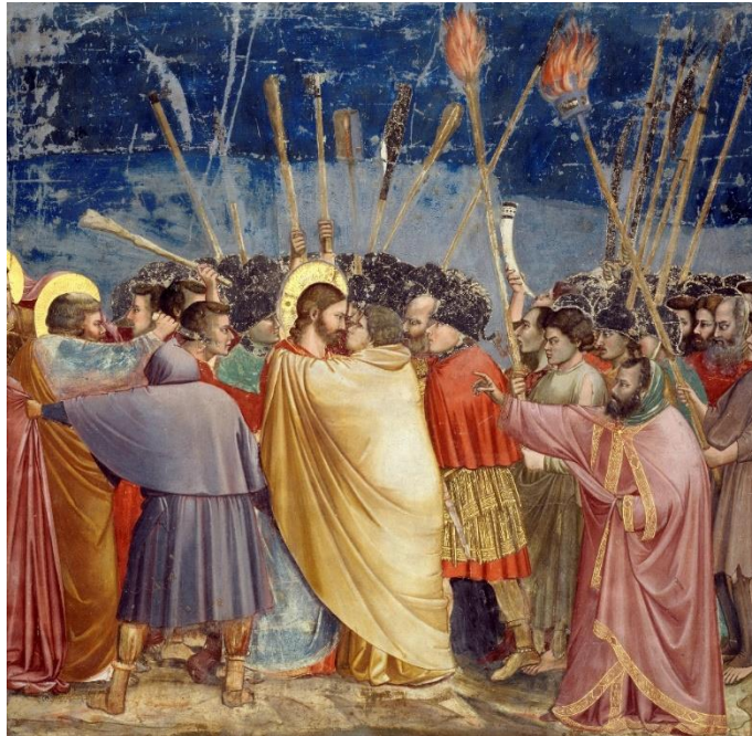
Giotto: Júdás csókja

— Maradjatok a kerten kívül csendben. Rejtőzzetek el! Ha rátörtök, elmenekül a fák között, s csak valamelyik tanítványát foghatjátok meg majd. Először majd én magam megyek be. Jól ismerem. Nem ijednek meg majd tőlem, mert én is a tanítványai között voltam. Majd én megkeresem őt. Csak engem figyeljete! Akit én majd megcsókolok, ő az, fogjátok meg őt!