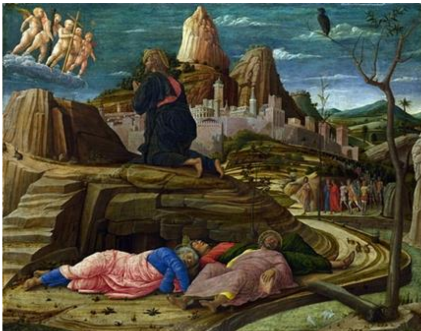
Andrea Mantegna: Imádság az Olajfák hegyén, 1455

— Uram, tudom, hogy borzalmas ez a pohár. Irtózat a szentnek az, hogy bűnné legyen. Az Atya is tudja, hogy borzalmas, de megmondta nekem, hogy nem lehet másképp. Nincs a kegyelemnek más lehetősége. Nincs a bűnös világ számára másképp váltság. Ki kell innod!