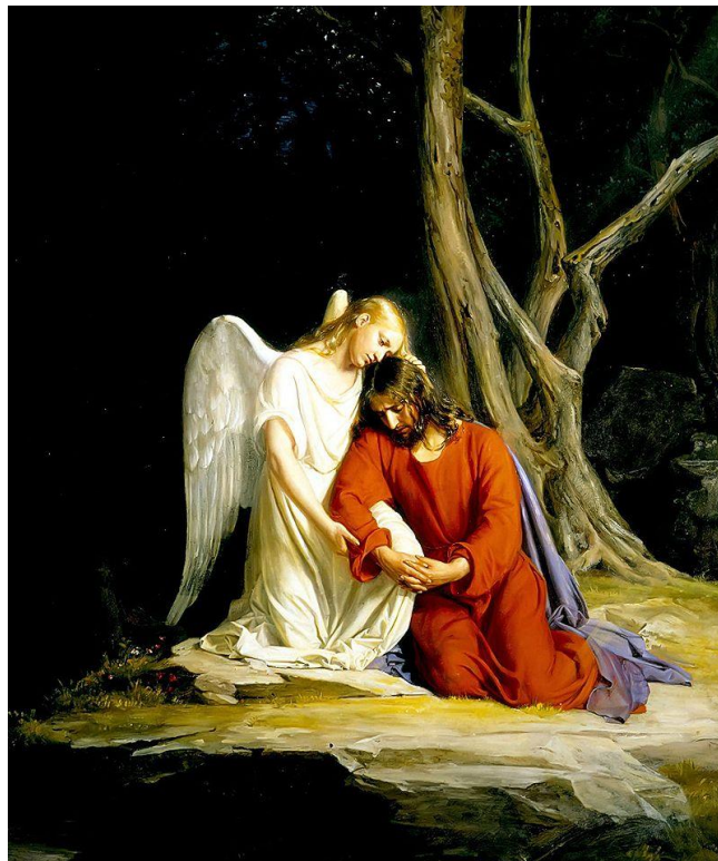
Carl Heinrich Bloch: Jézust egy angyal vigasztalja a Gecsemané-kertben.

Az angyal még mindig ott áll a régi helyén. Kezében a pohár. Arcán mélységes fájdalom s ajka újra csak azt ismételve: