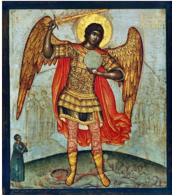
Simon Fjodorovics Usakov: Mihály arkangyal-ikon, Szentpétervár

Végig cseng az ÚR szava az aranyutcájú városon s a következő pillanatban hatalmas angyal áll az ÚR trónja előtt. Úgy magaslik ki a többi angyal közül, mint templomtorony a falu házikói közül. Széles vállán óriási szárnyak. Kezében kétélű éles kard. Olyan fényes, mint a tükör. Akárki megnézhetné magát benne. S oly nagy, hogy ami-kor a föld felé irányítva maga előtt tartja, ajkáig ér a markolatja. Mihály arkangyal. Vezéri alak. Szálegyenesen áll az ÚR előtt, mint katona a vezére előtt.